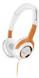
Sennheiser HD 229 Orange White