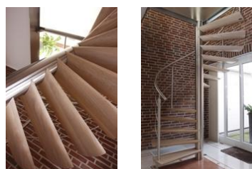
Links: Close-up van de spil van de trap met het onzichtbare ophangstelsel van de treden Rechts: Toepassing van de Moon Trap

Barneveld, 1 juli 2011 – Design hoeft niet duur te zijn. Dat bewijst EeStairs met het nieuwste designconcept: Moon Trap. Na de 1m2 trap, Cells Design en de TransParancy 1-03 serie is dit het nieuwste Standard Design. Dankzij de verschillende concepten is het mogelijk om met een beperkt budget een designtrap aan te schaffen.