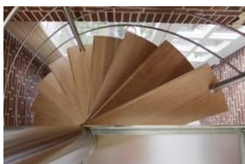
Moon Trap met bordes vanaf boven gezien, uitgevoerd met lichte, houten treden